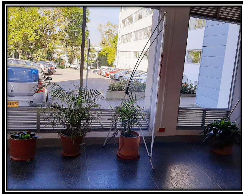
Ilustración 4 sala de espera Unisalud