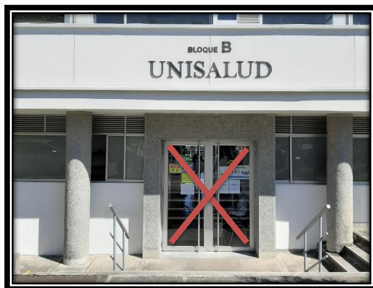
Ilustración 1 Acceso a Unisalud