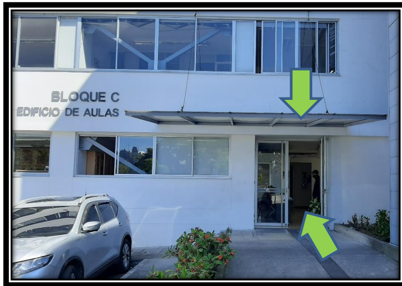
Ilustración 2 Acceso a Unisalud

2. El ingreso a Unisalud se realizará por la puerta principal de la Universidad, bloque C.